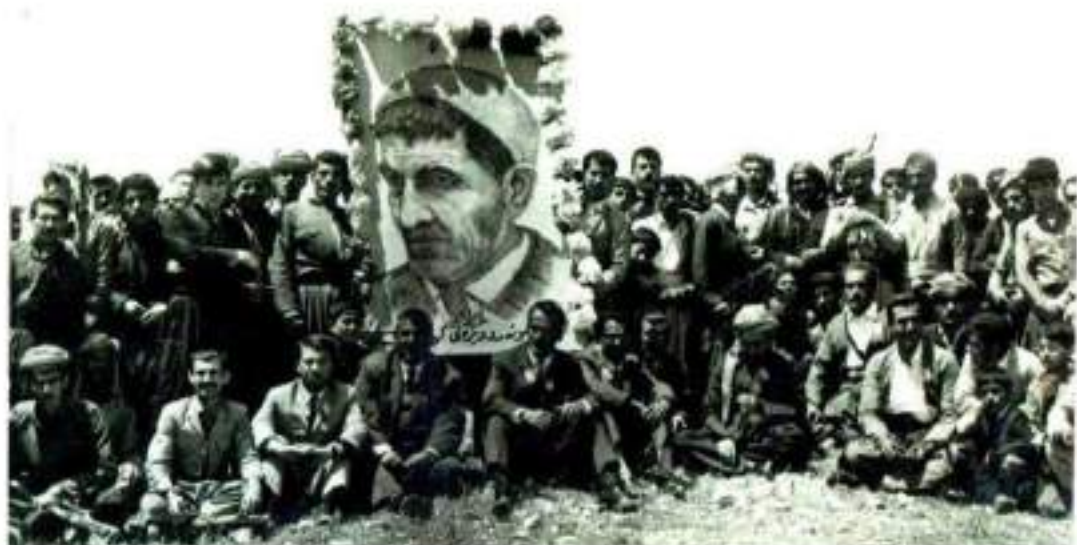
رئیس‌جمهوری گواستنه‌وه و ناشتنی تهرمی ماموستا (نه جمه‌دین مه‌لا) له چپای (نه‌زهر)