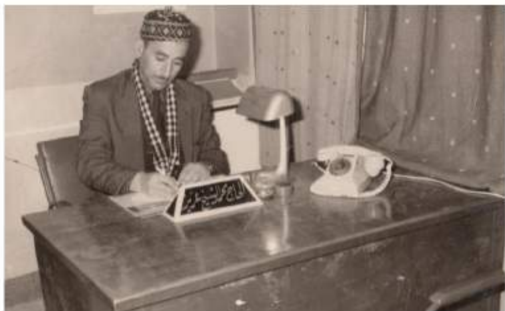
له ژوورهگه‌ی خۇی نه‌و کاته‌ی سه‌رۆکی برینپنجان بوو ( 08 . 10 . 1967 )