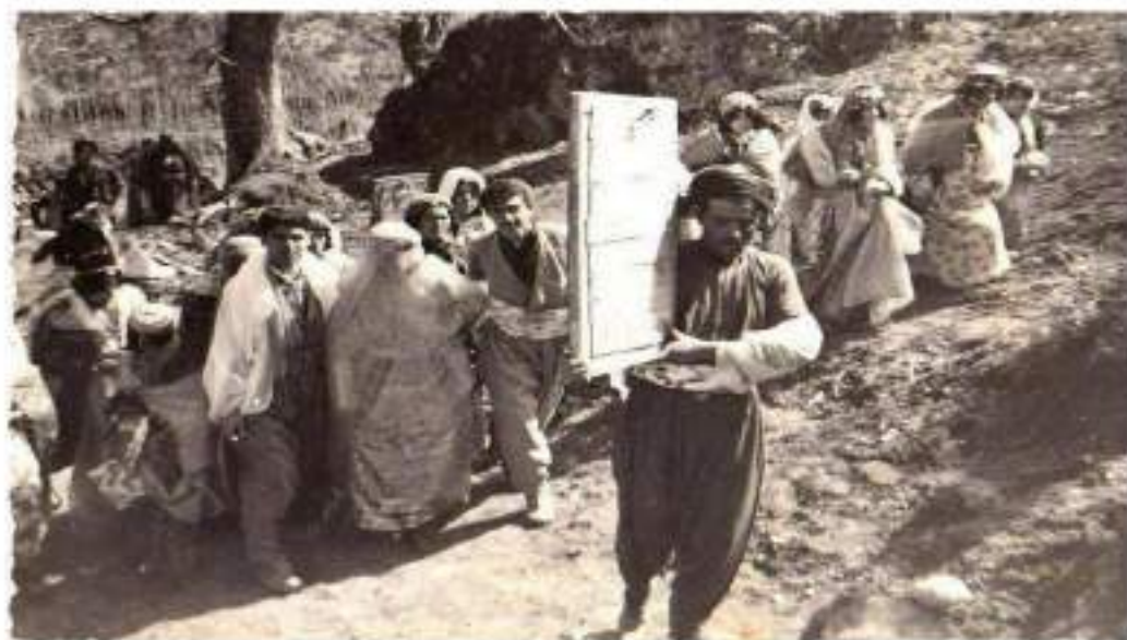
نەوونەى بووكىرەش لادىن ئەو سەردەمانە