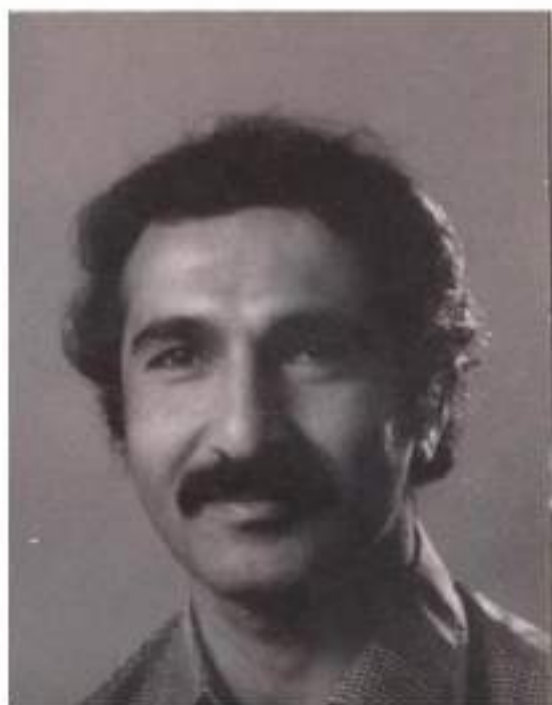
(نەمسا) كۈتايى سالى (1981)