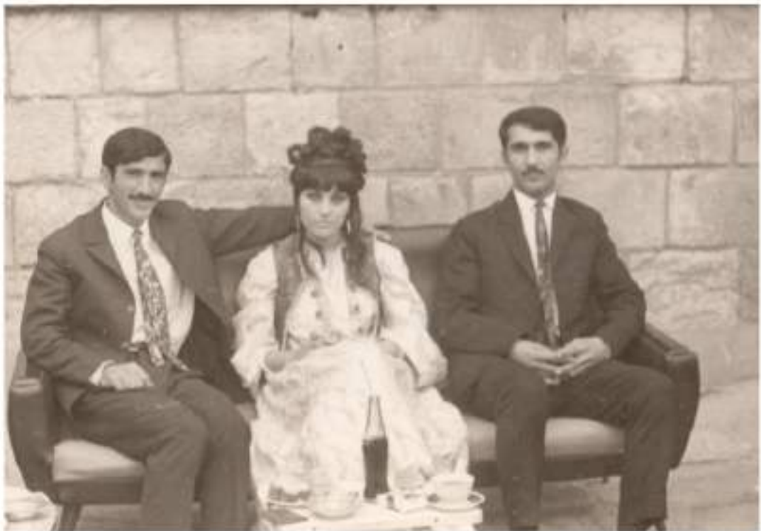
لە راستەۋە: غۇم، خۋالىخۇشبوۋان گەلاۋىژ ەۋەدولتەرىم و مامە سالىج

لەبەرئەۋە، مەلى خۇشەويستى دلە گەۋرە بزىو و گەپزكەكەى، لە ئەم چل بۇ ئەو چل دەفېرى و لەسەر ھىچ چلى ئۇقرەى نەدەگرت، تا بازى چارەنووس، بەسەر چلى چانسى خۇشەويستى خاتوو (گەلاۋىژ)ەۋە نىشتەۋە! ئەۋەبو، دۋاى خۇشەويستىيەكى كەم، داۋاىكرد، ھەموو لايەك قايلبوون. بۇيە ئىۋارەى پۇژى (30. 5. 1971)، لە مالى باۋكى بوكى، ناھەنگىكى خنجىلانەى خىزانىى سازكرا، من و دوكتور (لەتيف)پىش نامادەبووين. دۋاى نەۋەى كەمى دانىشتىن، زاۋا ئەلقەى لە دەسى بوكى كىرد، بە شىۋەيەكى فەرمى، پىۋەندى ھاۋسەرگىرى خۇيان راگەيانە. ئەۋ پىۋەندىيەش، ماۋەى (39) سال بەردەۋام بو، تا پۇژى (9. 9. 2011)، مامە كۆچىدۋاىيىكرد!