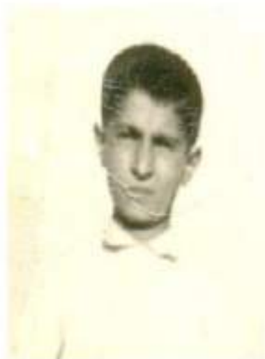
( پينجونين ) له ته مه نى ده ساييدا ( 1960 )