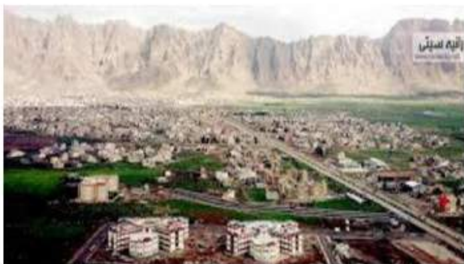
ۋىنەنى شارۋىچكەنى (رانى ئى ئى ئى)