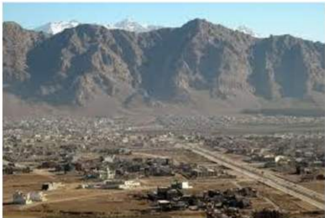
وینەى شارۆچكەى (رانی) ی كۆن

لە نیو (رانی)دا، ئەوهی زۆر دلم پینی دەكرایهوه، ئاوه جوانەكەى (قوولی) بوو. سەرچاوهكەى بە دیواریكى بازنەیی نزم دەورەدراوو، بە هەر چواردهوریشیدا، چیمەن و گول چینرابوو. لە نیو ئاوهكەشدا، چەن دارچناری پوابوو، دیمەنیکى زۆر جوانى هەبوو. لە ئەو دیویشهوه، ئاویكى زۆرى لەبەردەپۆى و چەمىكى تەنكى چكۆلانەى دروستكرد بوو. هەمیشە سەر بەردەكانى دەورویەرى چەمەكە، یەكینى دیکەى نەدەگرت، هیندە جەنجالبوو. نیو ئاوهكەش بەقاز، مراوى و سۆنەى ئىسكسوك پازابوووه، بەردەوام قېرەقېر و گارەگاریان دەكرد، وەك بەلەمىكى خنجیلانە، لەسەر ئاوهكە لەنگەریانگرتبوو، جارجاریش دەپۆیشتن و بە دواى خواردندا دەگەران. هەردوو بەرى ئاوهكەش، بە دار و درەخت گیرابوو، ئیدى دیمەنیکى هیندە جوان و ئاوازی هەبوو، ئاوهكەشى هیندە شیرین و سازگاربوو، وەك دەلین، سەد دەردى دەپەراند و مرۆ دلى نەدەهات، بەجیبیبیلی!