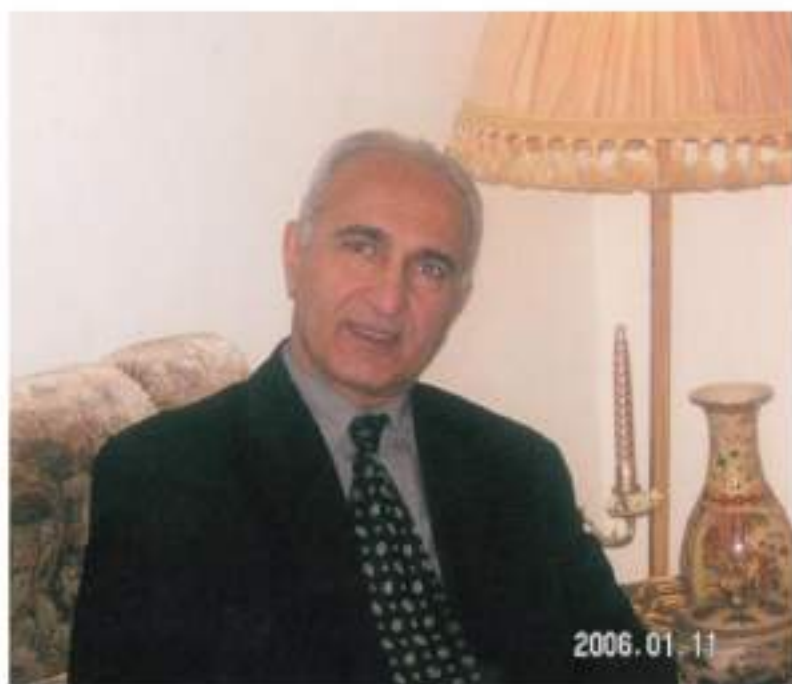
سوله يمانى سائى ( 2006 )