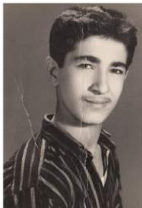
(سوله یمانی) له تهمه‌نی سیازده سائیدا ( 1963 )