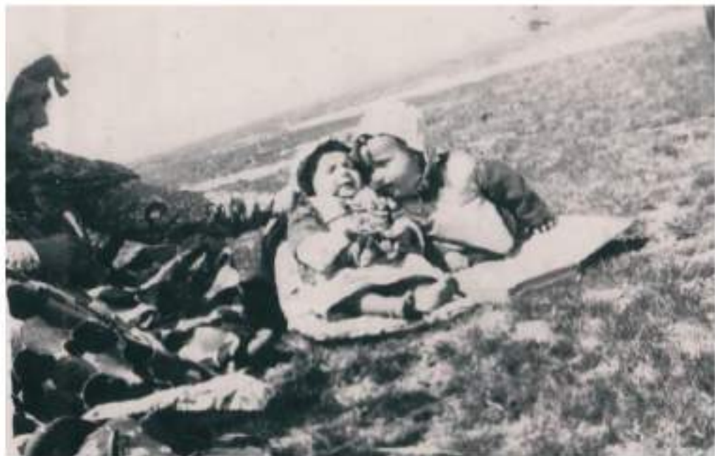
سالى ( 1950 ) له ته مه نى س مانگيدا ، له گه ل ( زيارى نوورى به گه ) شيرپرام له ( پينجونين ) ، له ته نيشتا منه وه دايكم ده سي به پشتمه وه گرتووه .