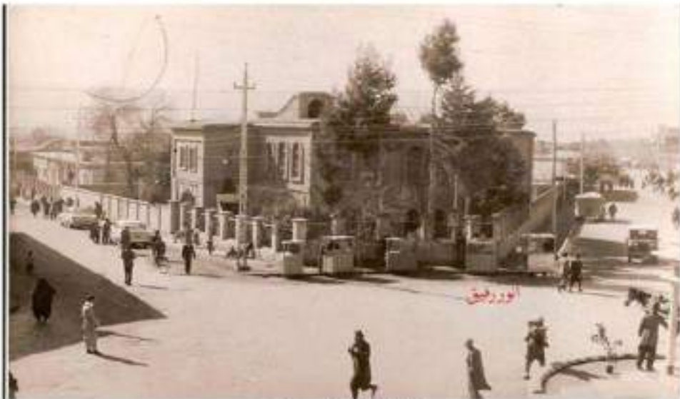
قوتا بخانهى ( فهيسه ئيبه )

كوپان بو، هيندى جار به ديواره كهدا سرده كهوتين و شه به برده مان له گه له كردن. كۆمهلى مامۆستاي بهرئيز و دلسۆزمان شه بوو، زۆر به پەرۆشبوون، بۆنه وهى بايه تهكان به باشى فيريين و پاشه پوژنيكى باشمان هه بي.