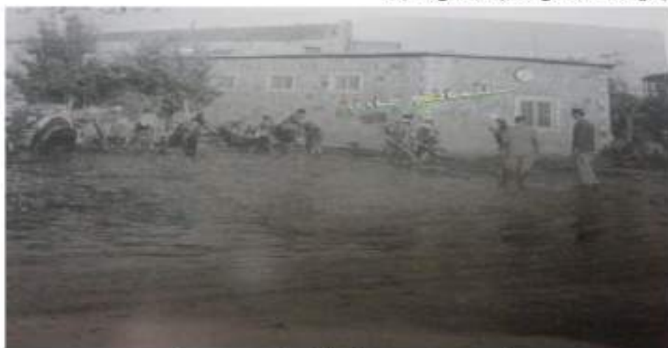
ويئهى بهردهركى سهرا و ههرمانگهى پۇستى (سوله يمانى)

ئيدى ههرچى چۇنى بوو، خيرا به جادهى (سابوونكه ران) دا سهركه وتم و گهيشتمه وه ماله وه. دايكم چاوه پيئدهكردم و زۇر بى نارامبوو. لافاوهكه پوژى (18، 10، 1957) بوو. زيانيكى زۇرى به خهلكى شار گهياند، وهك سهرچاوه كان باسيدهكهن: (12) منال، (5) پيار و (8) ژن خنكان، يهك ميليون دينار يش زيانيدا. ههر به نهو بۇنه يه شهوه، (وهصى - عهبولتيل) سهردانى (سوله يمانى) كرد.