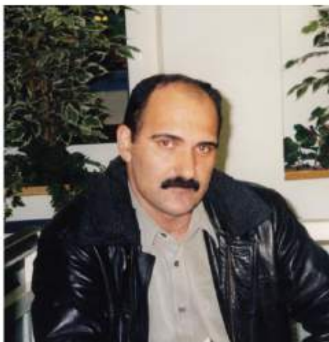
بارزان ( 1961 - )