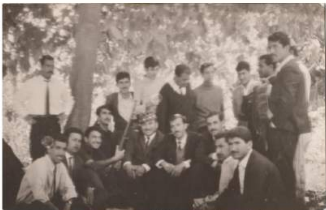
وینەى كۆمەنى خويندكار و ھىندى مامۇستا، ئەگەل (قادر ئەمىرىكى) بەرپوبەرى قوتا پخانە