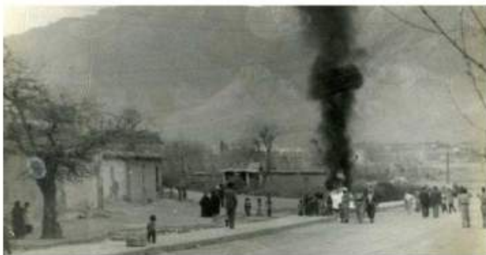
وینه‌ی دارتوو‌ه‌که و سەر کانییه‌که‌ی بهر مائی پورم

سەر کانییه‌که‌ی بهر مائی پورمدا داده‌نیشت، گهر یه‌کی ته‌ماشایکردایه، توپ‌ده‌بوو. ئیمه‌ش به‌رانبه‌ری ده‌ه‌ستاین و پئی پیده‌که‌نین. ئه‌ویش هرچی به‌ ده‌میدا بهاتایه، درئیغی نه‌ده‌کرد و ده‌یگوت، به‌ دیاری بۆ که‌سوکاری ده‌ناردین!