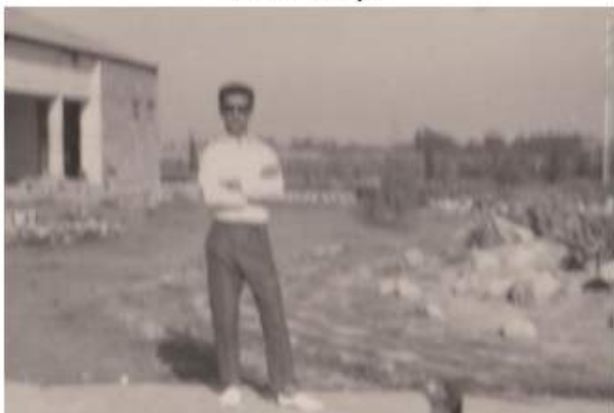
ئامادىي كىتوكالى بەكرەجۇ ( 1968 )