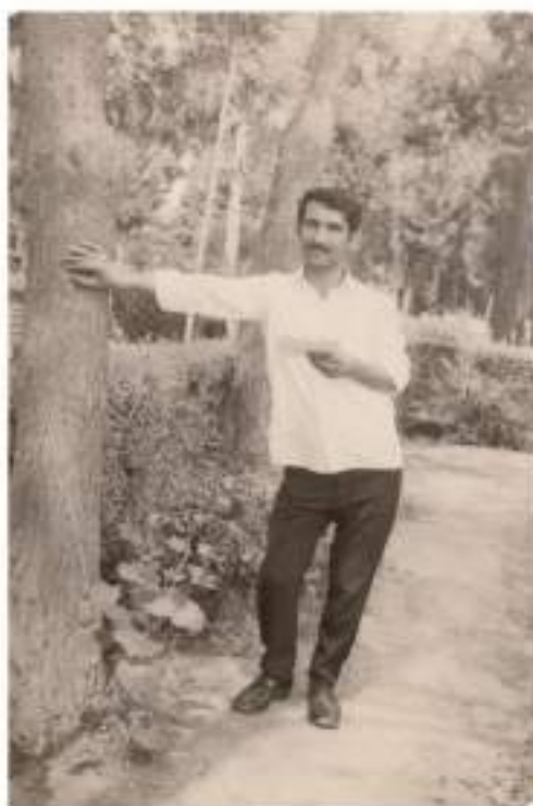
باغی گشتی سوله یمانی، پۇلى دووی كۆلیزگی كشتوكال ( 1972 )