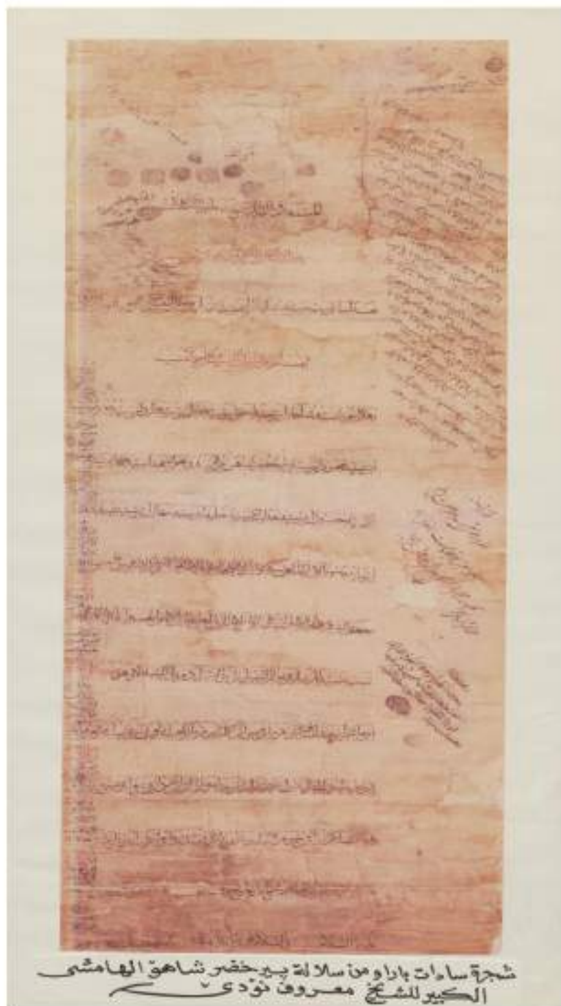
شجره سادات باراو من سلا له پير خضر شاهو الهامشي الكبير للشیخ معروف نوئیسی

دره ختی بنده مائه شیخانی (باراو)، پتر له (200) سال له مه و بهر، (شیخ ماری نوئیسی) په سه نديکرووه.