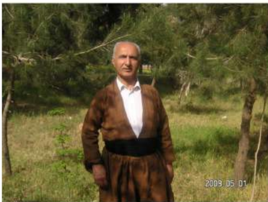
دەريەندى بازيان سانى (2009)