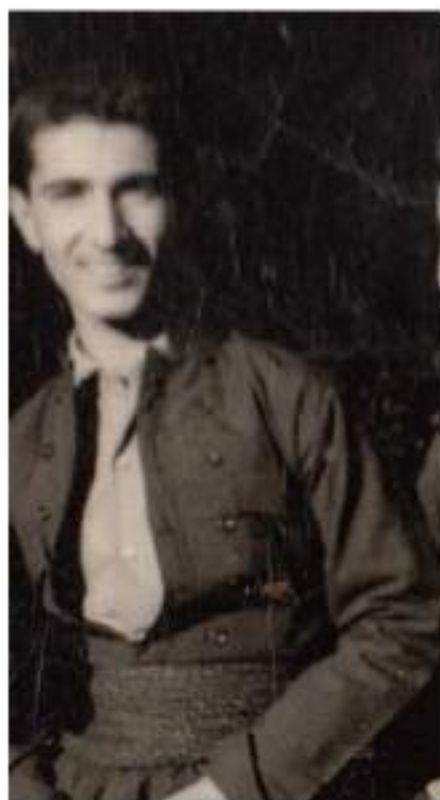
سەرچىنار سالى ( 1967 )