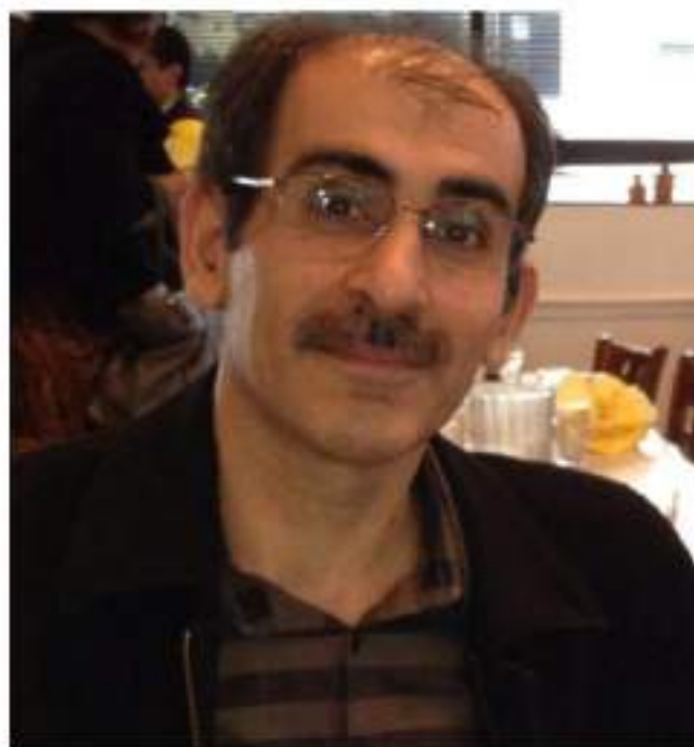
کاوآن ( 1963 - )