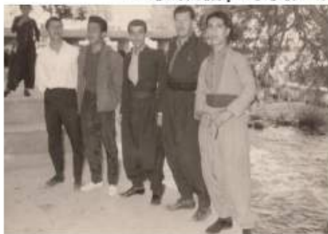
ئەم وىنەيە رۇژى ( 14 . 5 . 1967 )، لە باخەكەى (سەرچنار) گىراۋە،