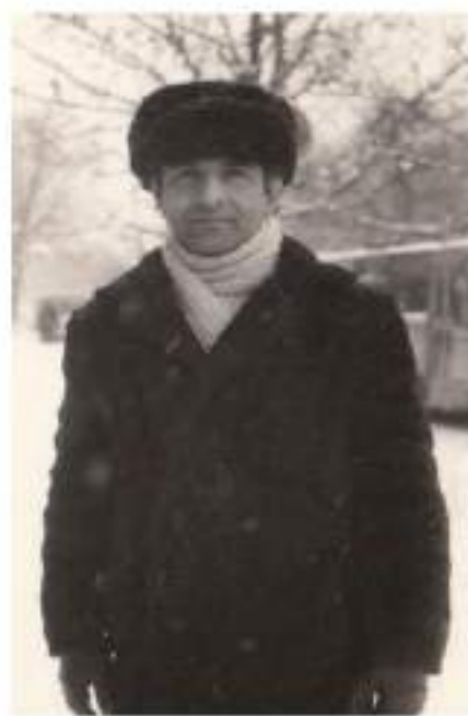
شارى (كيشينيۇڭ) يەككىتى سۇقنىت (1983)