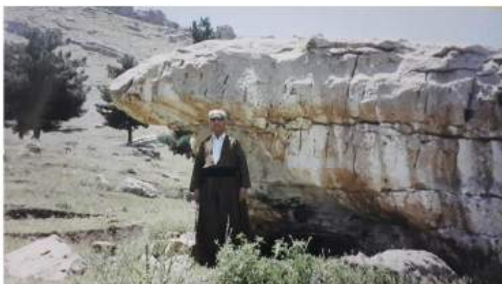
دەريەندى بازيان، بەردەقارمەن پۇڭى (27. 05. 2005)