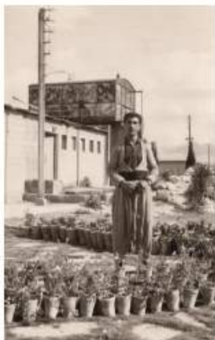
نەم وینەیه بە بۆنەى تەواوبوونى تاقىکردنەى كۆتایی پۆلى يەكەو، رۆژى (25. 6. 1968) گىراود.