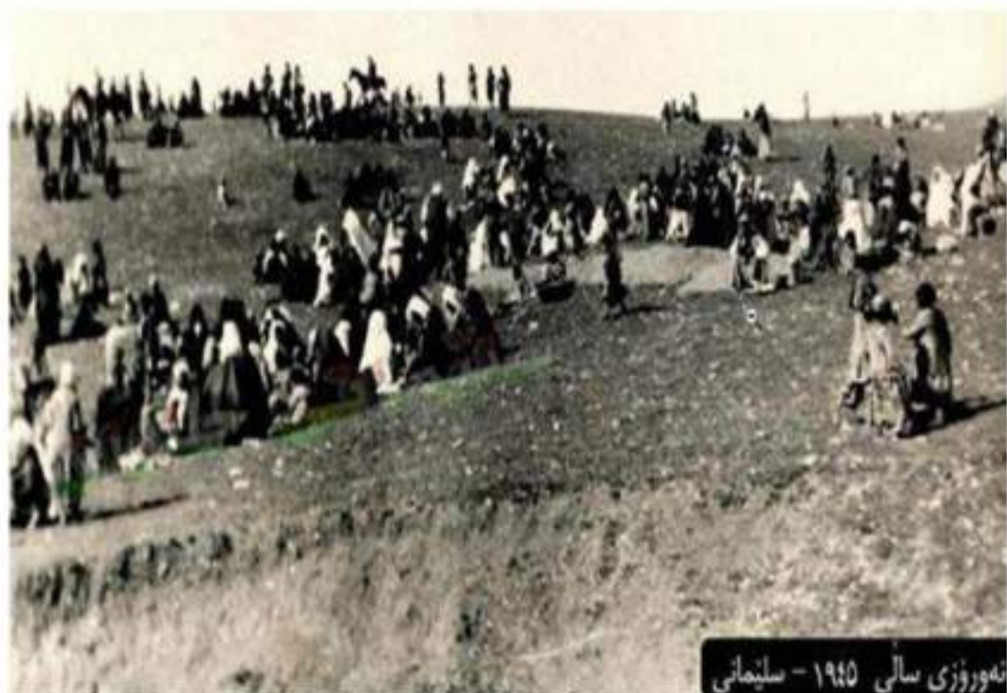
نەۋرۇزى سالى ۱۹۴۵ - سلیمانى

ئاخر جىژنى (نەۋرۇز)، تەنيا ھەر يادىكرىدەۋە، ئاگرىدەنەۋە، ھەلپەركى و گۇرانىگوتن نىيە، بەلكو لە ھەمان كاتىشدا، سەرەتاي پۇژىكى نۇي و ۋەرزىكى تازەي سالە، لە دەس سەرماوسۇلەي زستان، بەستەلەكى بەفر و سەھۇل، رىزگارمان دەبى، ۋەرزىكى خۇش دەسپىدەكا و ئاۋۋەموا دەگۇزى، شەو و پۇژ يەكساندەبىن، پۇژەكانى ئەو ۋەرزە، دەشتودەر بە گيا و گولەنرىگز دەرازىتەۋە، دىمەنىكى ھىندە جوانى ھەيە، گەشت و سەيران دەسپىدەكا، دل و ھۇشى مرۇ دەبۇۋژىنئەۋە!