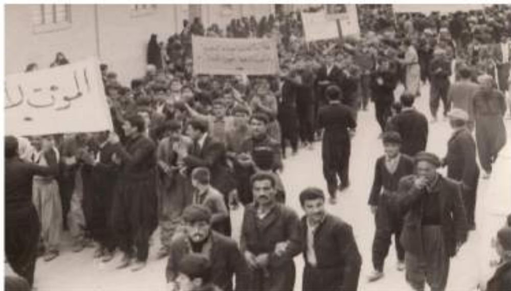
وینەدی بەشی لە خۆپیشاندا نەگە، نینە سەرپەرشتیماندا کرد