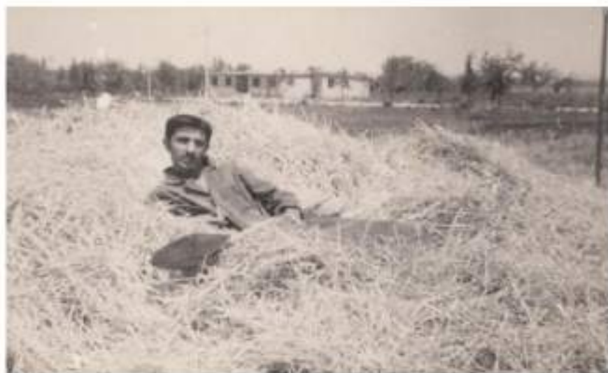
نهم وينه يه رۆژى (29 . 6 . 1968)، له خولى هاوينه گيراوه

بينگومان، هر كۆمهله قوتاييهك، له بهشيكى تايبهتى و لهسەر بهروبووميكى دياريكراو كارباندهكرد. مامۇستايهكيش سهريهرشتيدهكردن، هر خوشيان له سهركهوتن و پيشكهوتنى پرۆژهكەيان بهرپرسياربوون. بۆنهوهى قوتايان كارهكانيان پشگوى نهخن، زۇر بهكۆلۆدلهوه كاربهكن و به تهواوى فيرين، بهرئوهبهرايهتى قوتابخانه برياريدابوو، له (25)ى قازانجى داهاتى سالانهى خولهكه، بۇ قوتايان بى، لهبرئهوه پيشپرکئيهكى باش، له نيوان گرووپهكاندا دروستدهبوو، تا پتر كاربهكن و بهرهميشيان زيارترى. ههموو قوتاييهكيش بهدله، جزمه و شهيقهيان وهردهگرت، بيل و خاكهناز و ناميرهكانى ديكهى كشتوكالئيشيان، بۇ دابيندهكردن.