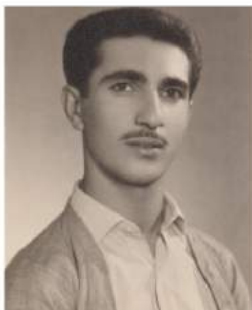
(سهرچنار) له تهمه‌نی یازده سائیدا ( 1965 )