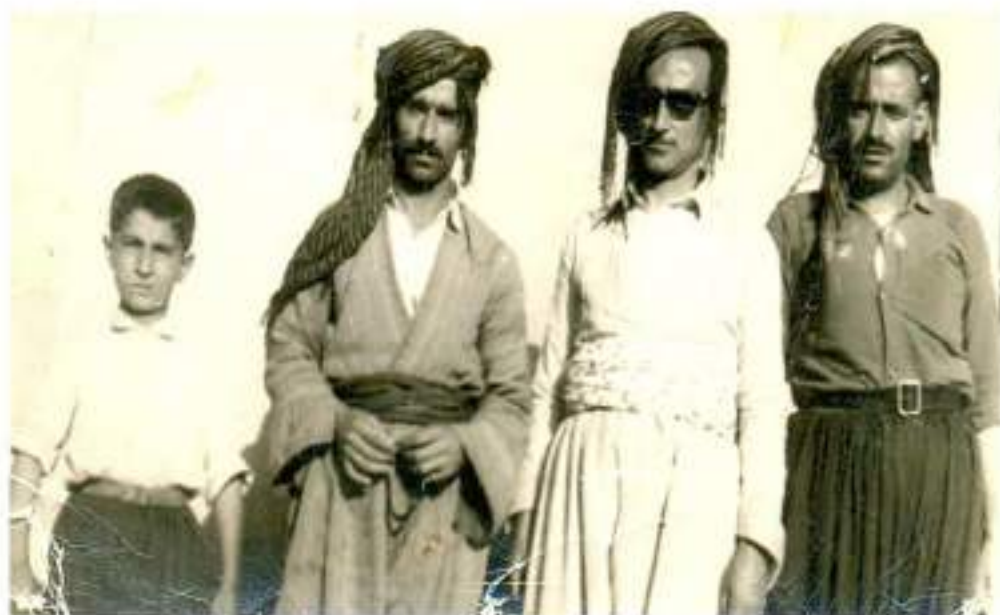
ھەر سى خوالىخوئاشبوو (عەبەى مەجى تەئەكەچى، باوكم، مامە بەكرم) و خۇم لە تەئەنى (10) سالىدا، لە بەردەم بارەگەى (پ. د. ك. - پىنجوئىن) بە بۇئەى مۇئەتوورگرتنەو گىراود.

بۇيە پۇرۇبەپۇرۇ: پتر خەنكى لى كۆدەبوو، كىرقى ژمارى ئەندام و ھوادارەكانىشى، لە بەرژبوونەوئەيەكى زۇر خىرا و سەيردا بوو. ئەو بوو، لە ماوئەيەكى زۇر كەمدا، ژمارى ئەندامەكانى، لە ژمارى ئەندامانى (پارتى كۆمۇنىست) نىكبوو بوو! ھەر ئەو پۇرۇ لە نىو شاردا، ھەرا و دەنگەدەنگ پەيدا بوو، (پارتى) لە پقى ھاوپى كۆمۇنىستەكان، چەن ترومبىلىكىان گرت، بە دەمۇل و زورناو، بە نىو (پىنجوئىن) دا دەگەرەن، ھەلدەپەرىن و گۇرانتىياندەگوت، خۇشەيەكى زۇر، لە نىو ھوادارانى (پارتى) دا بلاو بوو.