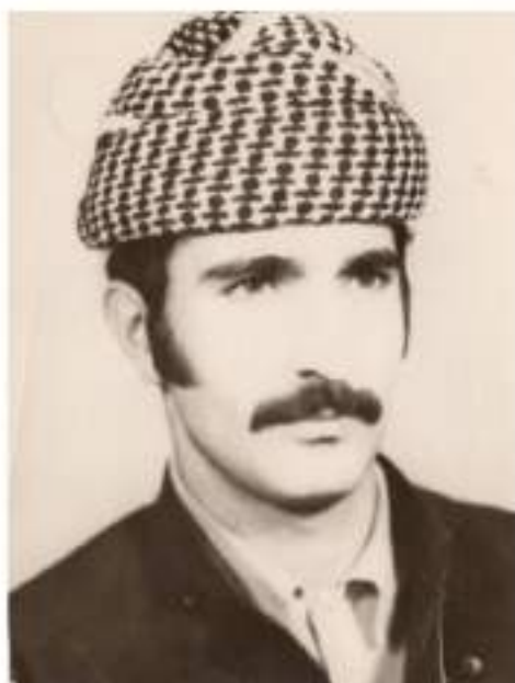
( پىنجوین ) ھیزی خەبات ( 1974 )