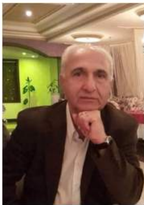
(سولەيمانى)، رېستورانى (رەمادە) ئىۋاردى رۇزى (6. 12. 2014)