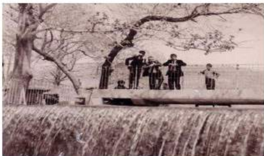
سەر ئاوەكەى (سەرچنار)، سالى (1960)

لاى راستى ھەوشەكەشمان بە كەوہر و كەروژ، پامى و تەماتە چاندبوو. ھیندە مائەكەمان خۆشبوو، بەھاران و ھاوینان، ھەرگیز لە مائەوہ بى تاقت نەدەبووین، بە تايبەتى لە سەریانەوہ، ھەموو (سەرچنار)مان لى دیاریوو، ھەمیشەش میوانمان ھەبوو. خۆشمان زۆر بوو بووین، پینج برا و خوشكى بووین، لە چیمەنەكە پێكەوہ یاریماندەكرد.