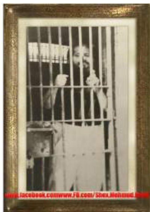
سائى (1956)، لە گرتوو خانەى سەرەوەى شارى (سولە يمانى) گىراو.

پاشان (شىخ) كامېرەيەكى سىنەمايى ھىنا و فىلمىكى پىشانداين، فىلمەكە سەبارەت سەردانەكەى خۇى بوو بۇ (قامېرە). ھەرچەندە فىلمەكە رەشوسپى بوو، بەلام ئىمە زۆرمان لا خۇشبوو، بە تايبەتى باخى ناژەلى تىدابوو، ھەموو جۈرە ناژەلىكى جوانى پىشانداين، كە پىشتر نەمان دىبوو. (شىخ)يش ھەمووى بۇ باسكردىن، چونكە فىلمەكە بىدەنگبوو. دەنگى خۇرەخۇرى مەكىنەكەش ناخۇشىكردبوو.