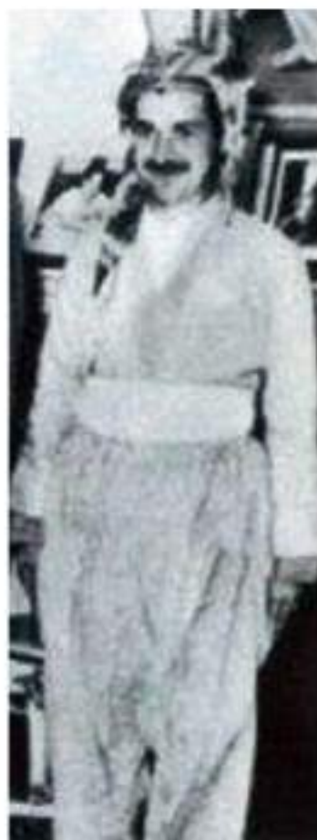
جهلال تائەبانی (1934 – 2016)