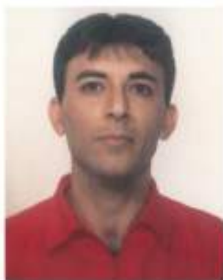
كامهران (1968 - )