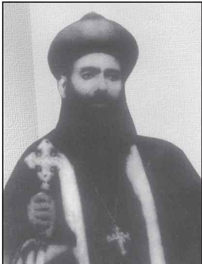
പ. പരുമല തിരുമേനി 29-ാം വയസ്സിൽ