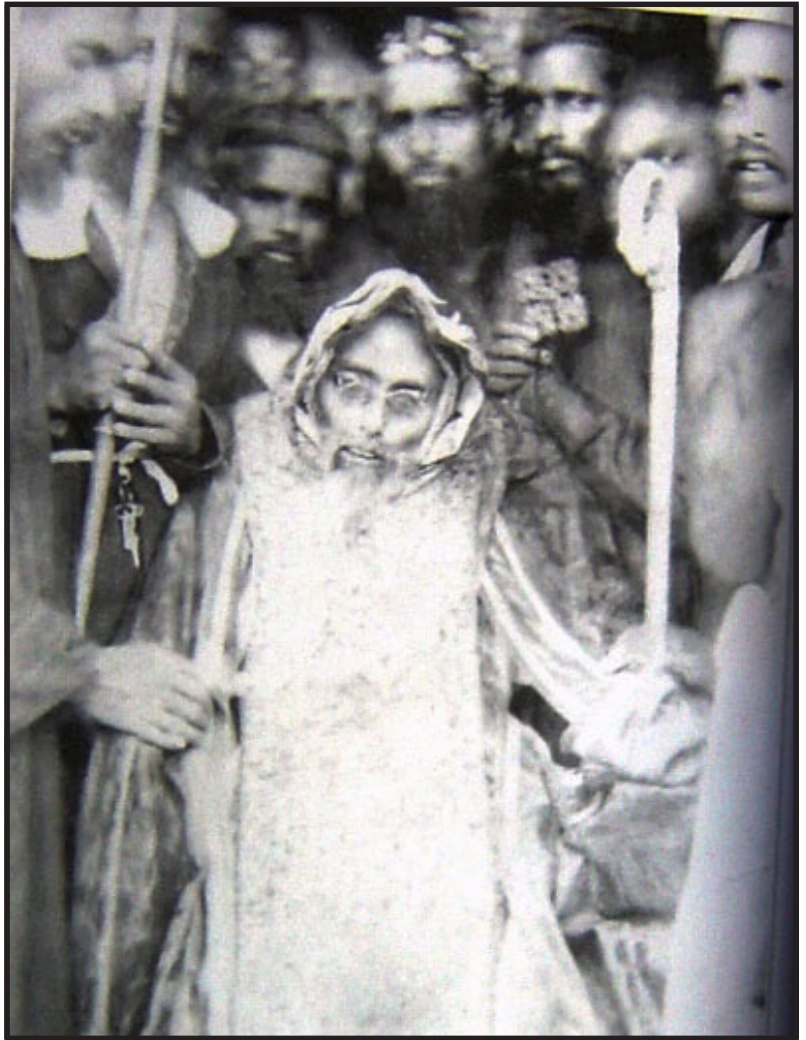
പ. പരുമല തിരുമേനിയുടെ കബറടക്കം

പിന്നീട് ഗീവർഗ്ഗീസ് ദ്വിതീയൻ കാതോലിക്കാ ബാവാ അനുവിട വ്യതിചലിക്കാതെ പിന്തുടർന്നു. ആ ചിട്ടകൾ അദ്ദേഹത്തിന്റെ ശിഷ്യനും സെമിനാരിയിലെ മല്പാനുമായ നരിമറ്റത്തിൽ യോഹന്നാൻ കത്തനാർ (പിന്നീട് യൂഹാനോൻ മാർ സേവേറിയോസ് മെത്രാപ്പോലീത്താ) ശരിയാംവണ്ണം പാലിച്ചു.