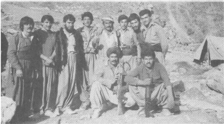
خاره خوڵه له گهڤ پۆلنك له پيشمه‌رگه‌كانى حزبى شىوعى له دواى پرۆسه‌ى به‌دناوى نه‌نفال سانى ١٩٨٨ بارمگاي نوگان