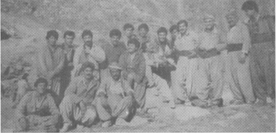
خاره خوڵه له گهڤ پۆلنك له پيشمه‌رگه‌كانى حزبى شىوعى له دواى پرۆسه‌ى به‌دناوى نه‌نفال سانى ١٩٨٨ بارمگاي نوگان