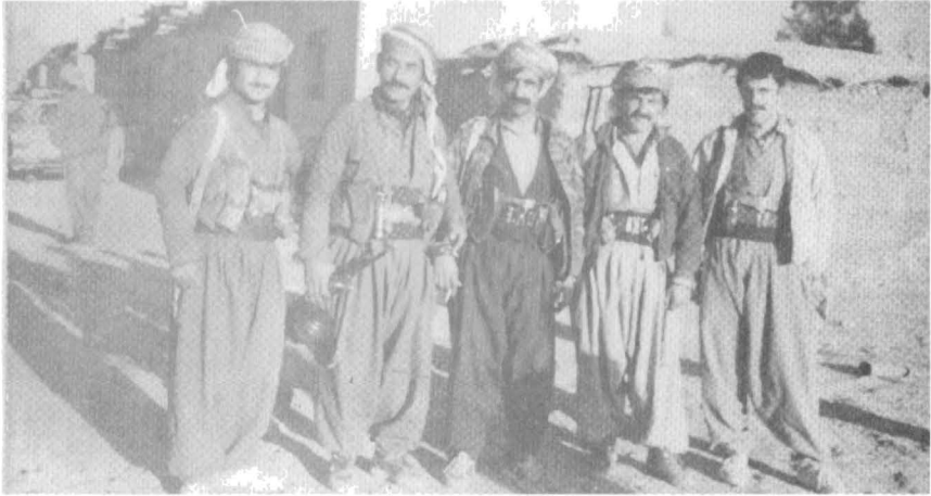
له دست راست، زیومر، شیخه، محهمهد نه بو شوارب، خاره خوله، هه ژار