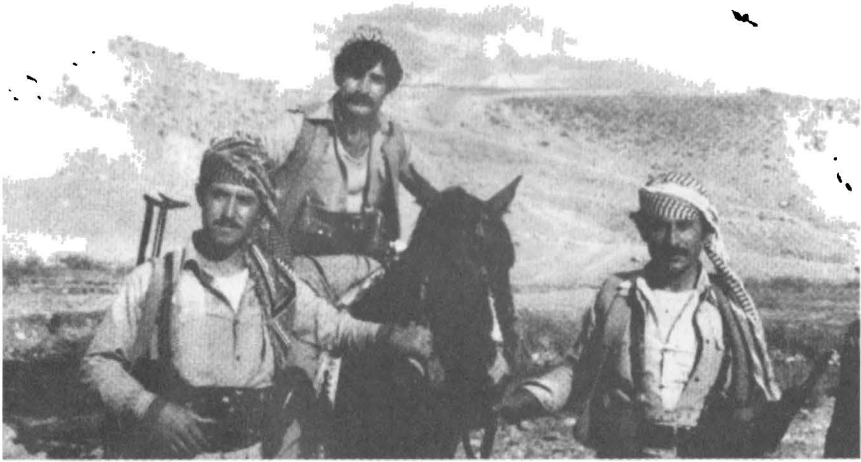
دهسته راست، خاره خوله، موخليس، سهرياز ١٩٨٢/٧/١ گوندى هه مزاوى نيران